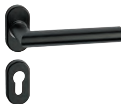
L14MRL09-32 Inox PVD GM