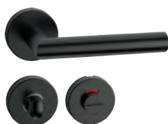
L14RWF52 Inox PVD GM