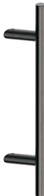
D25MS046-C0 (interasse 300 mm) Inox PVD GM