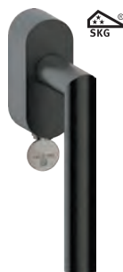
L14DKC80 Inox PVD GM