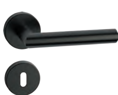
L14MRL52-31 Inox PVD GM