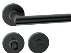
L14RWL52 Inox PVD GM