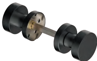
210PRL52 Inox PVD GM