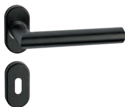
L14MRL09-31 Inox PVD GM