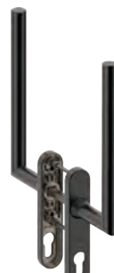
L14LD000 Inox PVD GM