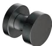
210PFL52 Inox PVD GM