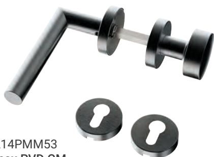
L14PMM53 Inox PVD GM