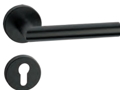
L14MRL52-32 Inox PVD GM